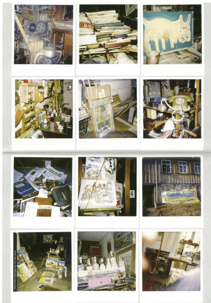
Abb. 2: Polaroidfotografien vom Nachlass Hans Krüsi. 2007/2008