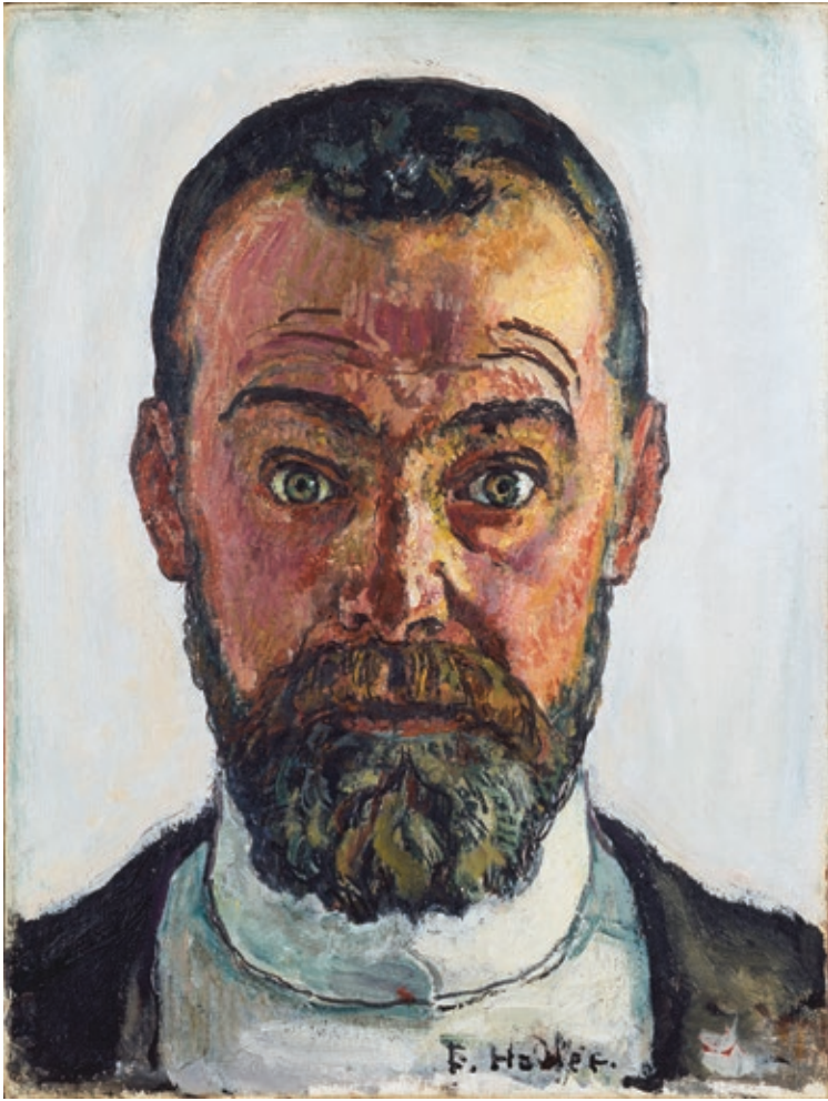
Abb. 4, Kat. 883: Ferdinand Hodler, Selbstbildnis , 3.2.1912, Öl auf Leinwand, 35,5×27 cm, Kunstmuseum Winterthur, Foto: Kunstmuseum Winterthur

Zur Erprobung eines Porträttyps gehört auch dessen sofortige Abwandlung. Auf eine erste streng symmetrisierte Darstellung einer Halbfigur von 1887 brachte Hodler im Bildnis Louis Bourget von 1889 den plastisch dargestellten Kopf symmetrisch in die mittige Vertikale, den Körper aber leicht in Schräglage (Abb. 1, Kat. 770). Wie in diesem Porträt des Arztes und Freundes interessierte sich Hodler in zahlreichen weiteren Bildnissen für die Entgegensetzung von unbeweglicher Symmetrisierung und subtiler Verlebendigung durch Verschiebungen und Schrägstellungen, etwa mit einer Halsbinde oder einer Knopfleiste.