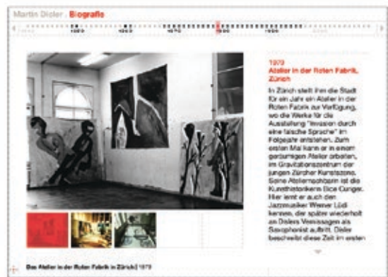
Abb. 3: 2007 veröffentlichte SIK-ISEA auf www.martin-disler.ch eine Webdokumentation zu Martin Disler. Die aufwendig gestaltete Einstiegsseite mit Animationen, Video- und Audiofiles vermittelt einen Einblick in die Biografie und in die verschiedenen Arbeitsgebiete des Künstlers.

Im Unterschied zum gedruckten Buch können die Daten einer Online-Publikation aktualisiert werden. Dank der engen Anbindung an die Datenbank von SIK-ISEA ist diese nachträgliche Überarbeitung bei den jüngeren im Netz veröffentlichten Werkkatalogen aus technischer Sicht mit geringem Aufwand verbunden. Dennoch stellt das Nachführen von Informationen in einem Zeitalter, in dem auch