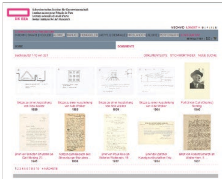
Abb. 6: Kunstarchiv online, Schweizerisches Kunstarchiv, Screenshot der Website von SIKART

Das Schweizerische Kunstarchiv ist kein Kuriositäten-Kabinett, wie es die Kunstkammern noch waren. Vielmehr ist es Teil der Forschungsinfrastruktur, die SIK-ISEA seit Jahrzehnten bereitstellt. Gleichgeblieben ist eines: Das Kunstarchiv soll wie die Kunstkammer ein Ort der Neugierde und des Austausches sein, eine Drehscheibe, die Informationen zur Kunst in der Schweiz vermittelt, und schliesslich auch ein Ort der Bildung. Alle Interessierten sind herzlich eingeladen, die Angebote im Web zu nutzen, die Veranstaltungen zu besuchen und die Bestände vor Ort zu konsultieren (Abb. 7).