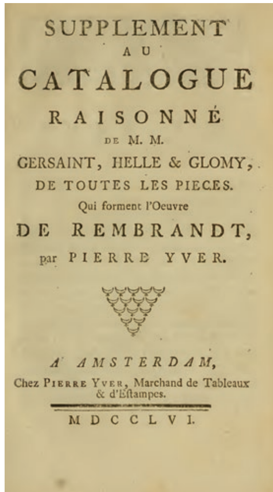
Abb. 1: Pierre Yver, Supplement au catalogue raisonné de M.M. Gersaint, Helle & Glomy, de toutes les pièces qui forment l'oeuvre de Rembrandt , Amsterdam: Pierre Yver, 1756, Digitalisat: The Getty Research Institute, LA

Für die Publikation des Catalogue raisonné der Gemälde von Ferdinand Hodler setzte sich SIK-ISEA zum Ziel, Buch und elektronische Publikation mit Hilfe einer