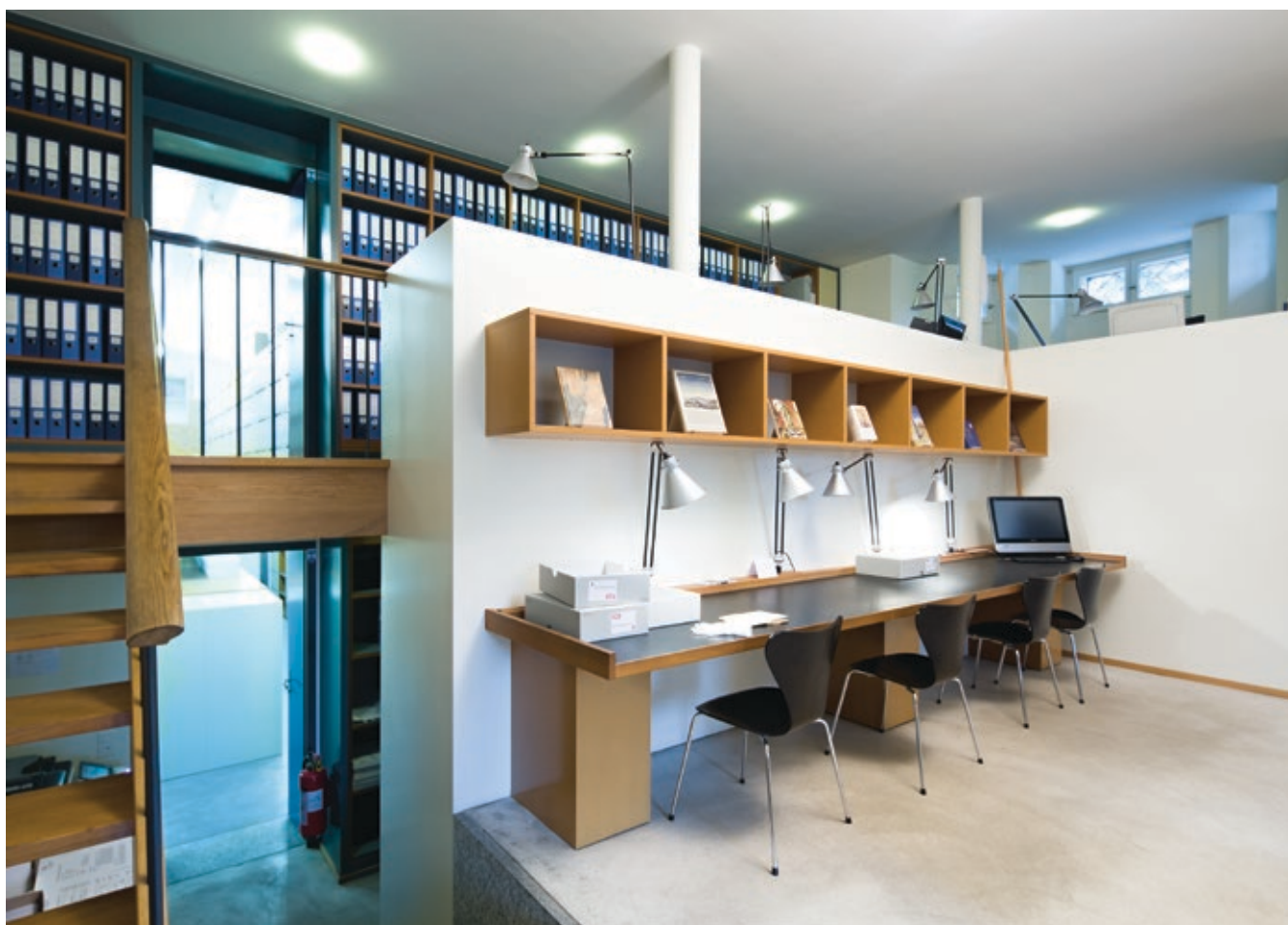
Abb. 7: Schweizerisches Kunstarchiv in der Villa Bleuler, Arbeitsplätze für Benutzer und Benutzerinnen, im Hintergrund Eingang zu den Depot-Räumen