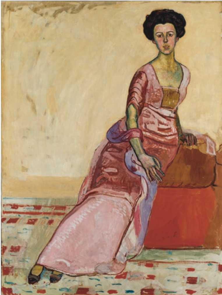
Abb. 6, Kat. 868: Ferdinand Hodler, Bildnis Gertrud Müller , 1911, Öl auf Leinwand, 175 × 132,5 cm, Kunstmuseum Solothurn

Der vorliegende Band enthält die Würdigung von Hodler als Bildnismaler, ferner die Analysen sämtlicher Porträts aufgrund neuer Forschungsergebnisse, dazu die Abbildungen aller authentischen Werke in Farbe. Die Online-Version dieses 2. Bandes des Catalogue raisonné wurde zeitgleich mit der Präsentation des gedruckten Buchs aufgeschaltet.