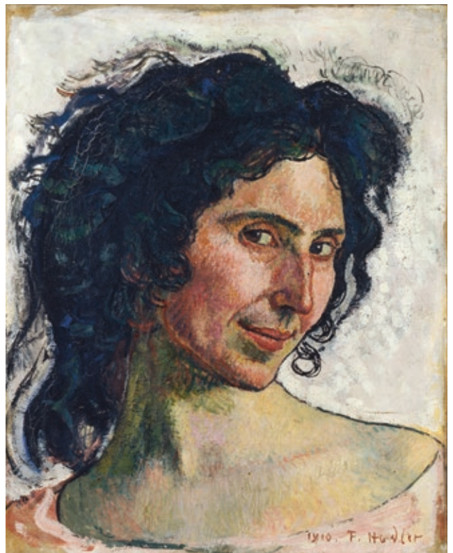
Abb. 3, Kat. 849: Ferdinand Hodler, Bildnis Giulia Leonardi (Italienerin) , 1910, Öl auf Leinwand, 41 × 33 cm, Privatbesitz