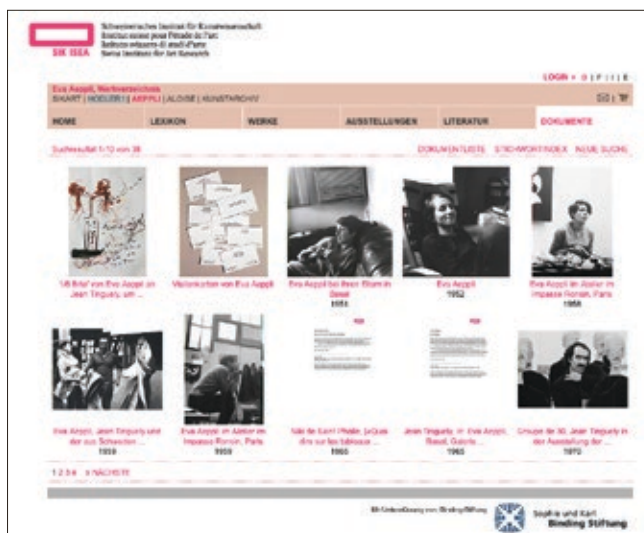
Abb. 6: Das 2012 von SIK-ISEA auf www.eva-aeppli.ch veröffentlichte elektronische Werkverzeichnis zum Schaffen von Eva Aeppli ist ebenfalls kostenlos zugänglich. Durch Volltextsuche recherchierbare Dokumente und Fotos erweitern den Kontext des Werkverzeichnisses.