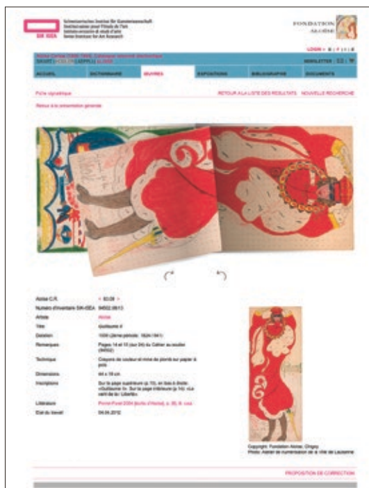
Abb. 5: SIK-ISEA schaltete 2012 auf www.aloise-corbaz.ch den elektronischen Catalogue raisonné über das Schaffen von Aloïse Corbaz zur freien Konsultation auf. Ansicht des Blättermodus im Zeichenheft «Cahier au soulier» (1924–41), C.R. 63.08.

Eine periodische Aktualisierung, zusätzliche Recherchemöglichkeiten sowie die Ergänzung des Abbildungsapparats machen aus den elektronischen Werkverzeichnissen ein komplementäres Medium zum gedruckten Buch. Darüber hinaus kommt ihnen sowohl in Kombination mit einem Buch als auch als eigenständige Publikation aufgrund ihrer Vernetzbarkeit mit Wissensportalen und des erleichterten Zugangs zu aktuellen Forschungsergebnissen eine entscheidende Rolle in der kunsthistorischen Wissensvermittlung zu.