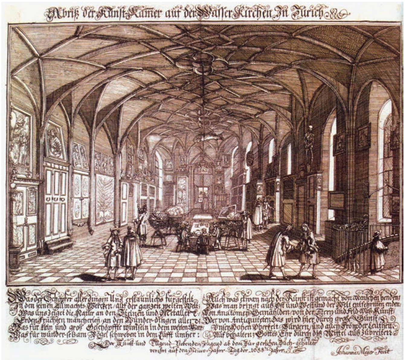
Abb. 1: Johannes Meyer, Abriss der Kunst-Kammer auf der Wasser Kirchen In Zürich , 1688, Radierung auf Papier, 17 × 26 cm (Plattenmass), Zentralbibliothek Zürich