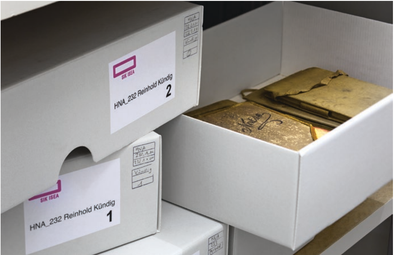
Abb. 3: Nachlass Reinhold Kündig, Schweizerisches Kunstarchiv, Skizzenbücher in Archivsachteln, Foto: Philipp Hitz, SIK-ISEA