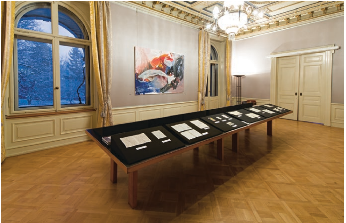
Abb. 4: Archivist's Choice: Präsentation ausgewählter Briefe von Giovanni und Alberto Giacometti, Foto: Philipp Hitz, SIK-ISEA