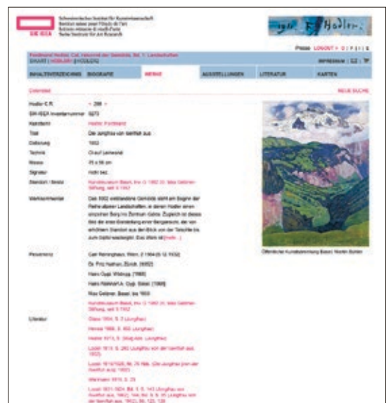
Abb. 4: Der seit 2009 von SIK-ISEA auf www.ferdinand-hodler.ch veröffentlichte elektronische Catalogue raisonné der Gemälde von Ferdinand Hodler ist zugänglich für Eigentümer der jeweiligen Bände, die zusätzlich das Recht auf einen Online-Zugriff erworben haben. Die Ansicht von Kat. 298 zeigt Die Jungfrau von Isenfluh aus mit verlinkten Angaben zur Provenienz sowie zu weiterführender Literatur und zu Ausstellungen, an denen das Werk präsentiert worden war.