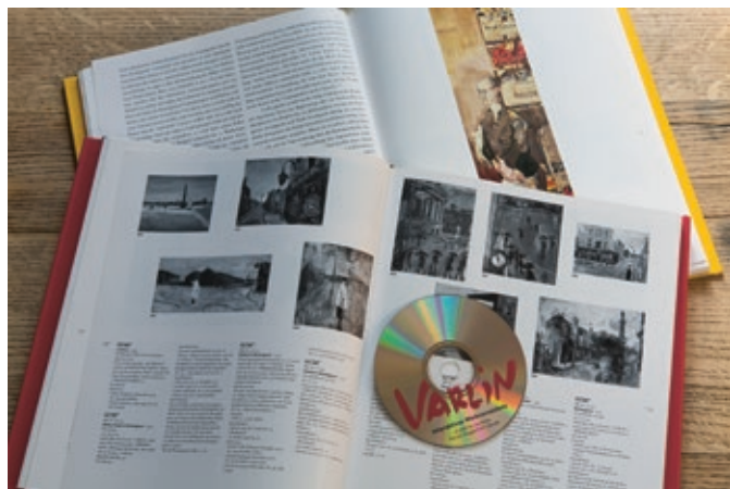
Abb. 2: Im Jahr 2000 gab SIK-ISEA mit den Autorinnen Paola Tedeschi-Pellanda und Patrizia Guggenheim das Werkverzeichnis von Varlin (Willy Guggenheim) heraus. Dem zweibändigen Werk lag eine von Tobias Eichelberg produzierte CD-ROM für Recherchen im interaktiven Werkverzeichnis bei.