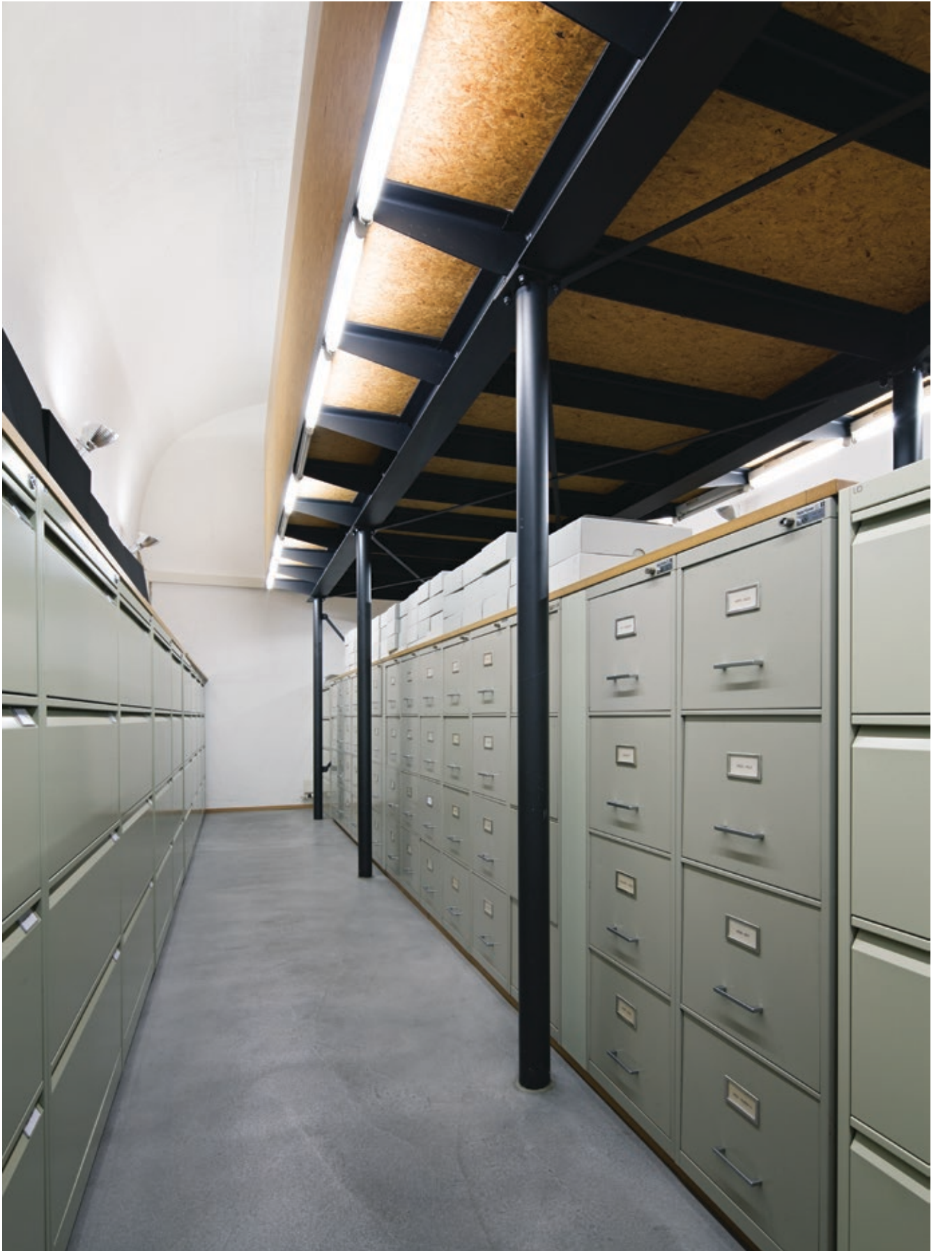
Abb. 2: Blick ins Depot des Schweizerischen Kunstarchivs in der Villa Bleuler, Registerschränke und Dokumentations-Dossiers, Foto: Philipp Hitz, SIK-ISEA