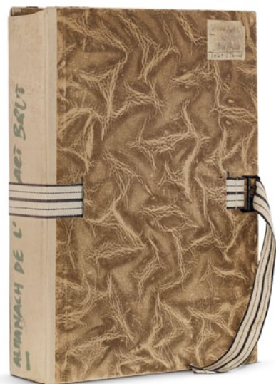
Almanach original Légende à compléter Oloreius sit magnimum et faces eos est fugitas moluptu scienient faci