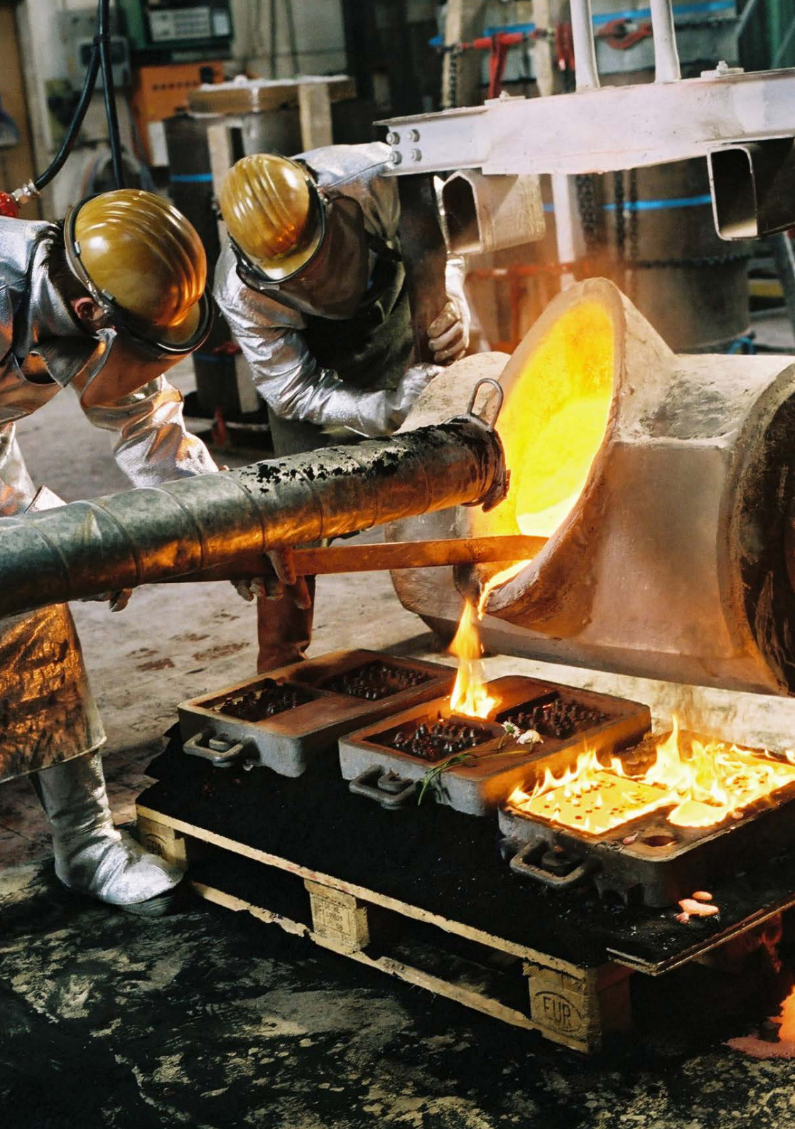
Kunstgiesserei St. Gallen